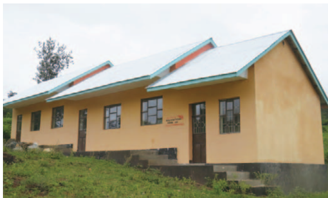
新たに建設された小学校

学力テストが開催され、優秀な生徒や学校を表彰するという取り組みも始まりました。これまでのADPの支援活動と行政や地域住民の努力の結果、小学校入学率は65.9%（2009年）から82.0%（2013年）へ、児童の出席率も72%（2013年）から93%（2014年）へと大幅に向上しています。