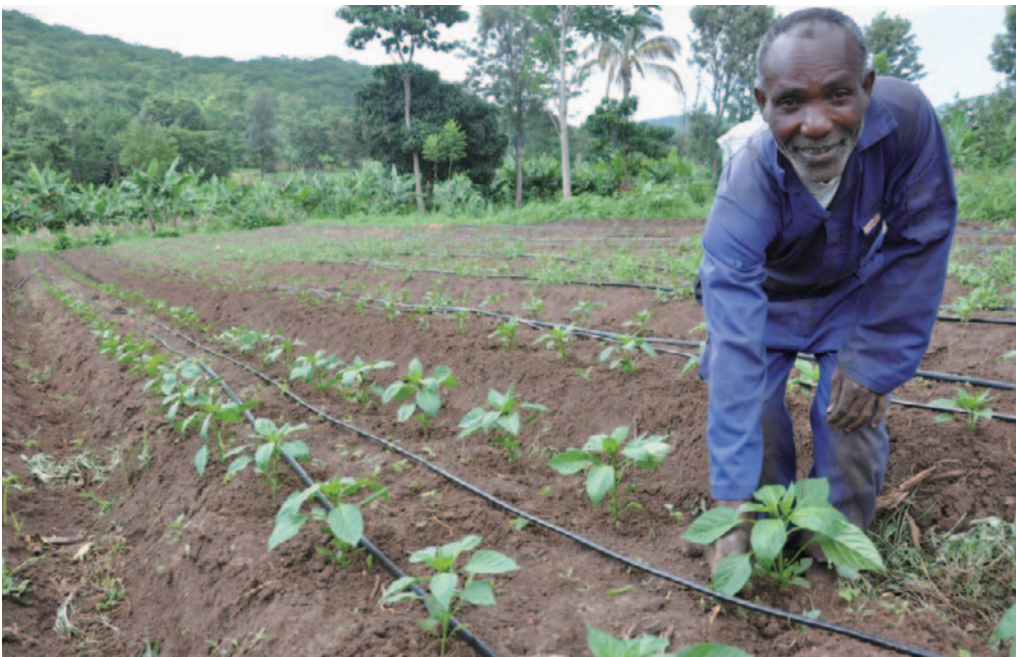
ピーマンを栽培する生産者グループのメンバー。畑には点滴灌がいシステムも導入されています

十分な食料を得られる世帯 $ 24.0%（2008年） → 78.7%（2014年）