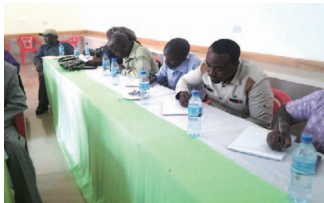
研修に参加する教師たち