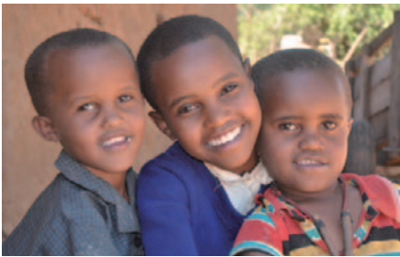
支援により子どもたちが健やかに成長できる地域へと変わりつつあります

チャイルドとの手紙の交流や毎年の成長報告などを通して、支援の成果を実感していただくための活動を行っています。チャイルドの成長を定期的にモニタリングし、支援事業がチャイルドとその家族、地域の人々の生活をどのように改善しているか確認を行うほか、チャイルドの家族や地域の人たちが「子どもを中心とした開発」を理解し、支援活動の中心を担っていくような啓発活動も行っています。このほか、地域内の村々の指導者に対して出生証明書の重要性を説明しました(この証明書がないと教育や医療といった公的サービスを十分に受けることができません)。彼らはそれぞれの村に帰って、親たちを啓発し、487人の子どもたちが出生証明書を得ることができました。