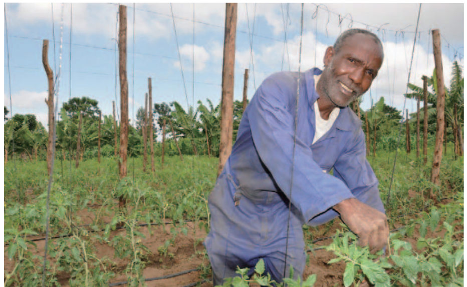
トマトを栽培する生産者グループのメンバー。研修で学んだ栽培方法を実践しています