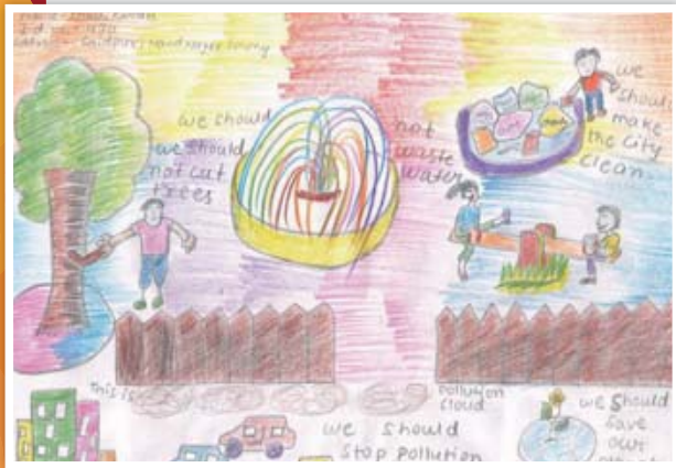
チャイルドの絵「生活のルール」(クーシ、16歳)

能力開発講習会に参加した22の子ども保護グループのメンバーが、子どもたちの生活状況に注意を払い、きちんと学校に通っているか確認しています。また、地域の中で子どもたちが安全に保護されるよう取り組んでいます。