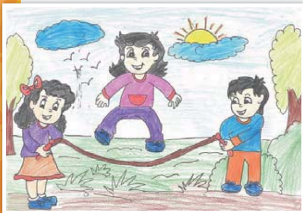
チャイルドの絵「遊ぶ子どもたち」 (ディープシカ、15歳)

合計77の子どもクラブの活動を通して、子どもたちが学び、楽しく過ごし、地域の行事に参加しています。