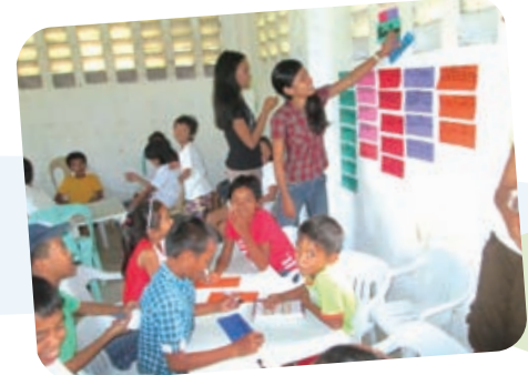
一年間の活動について振り返る子どもたち。子どもたちも地域の課題を考え、活動に積極的に参加しています

子どもたちが、自分たちの住む地域づくりに参加することはとても大切です。1年間の振り返りミーティングを開催し、64人の子どもたちが参加しました。子どもたちは、自分たちが住んでいる地域で起こっている変化をよく見ています。会議では、それぞれの地域が抱える課題、それに対する取り組みによって地域がどのように変化しているか、またその変化が子どもたちにどのように影響しているかについて、子どもたちの目線で話し合いました。子どもたちの意見は、今後のADPの実施計画にも反映されます。