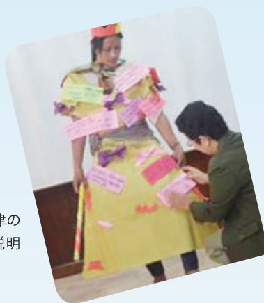
子どもの権利を守る法律の必要性を分かりやすく説明しています