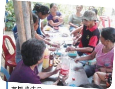
有機農法の作り方について学ぶ講習会の様子

有機農法のトレーニングの一環で、有機肥料の作り方についての講習会を開催し、40人の農民と20人の母親が参加しました。講習会で実際に有機肥料を作ることで、自分たちの地域で手に入る材料で、安く安全な有機農法を行えること、地域でよく発生する害虫や病気に対してもより安い技術で対応でき、多くの収穫を得られることを学びました。参加者は、「余った作物や材料など、ゴミだと思っていた物も有効に使えることを知って驚きました」と語ります。また母親たちも、「学んだことを自宅の家庭菜園で実践し、子どもたちのために無農薬の野菜を収穫したいです」と話してくれました。