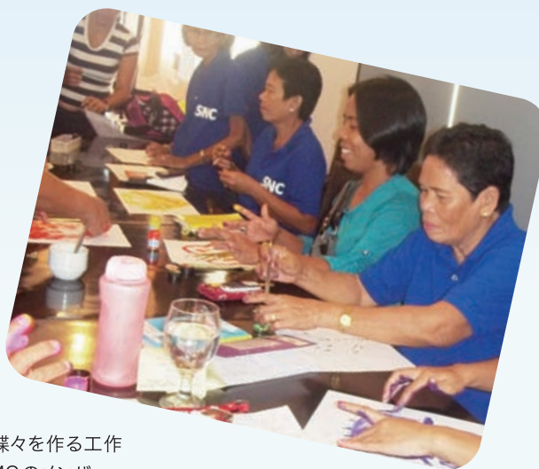
手形から蝶々を作る工作を学ぶCMCのメンバー

ものとなり、また、スポンサーシップ・マネジメント・プロジェクトを円滑に進めることができるように、メンバーへの研修を定期的実施しています。月日が経つにつれ、メンバーたちの責任感と自信が高まっています。