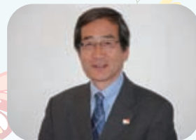
特定非営利活動法人 ワールド・ビジョン・ジャパン 常務理事・事務局長

皆さまのチャイルド、そしてすべての子どもたちが健やかに成長できる地域となることを目指し、活動を続けてまいります。