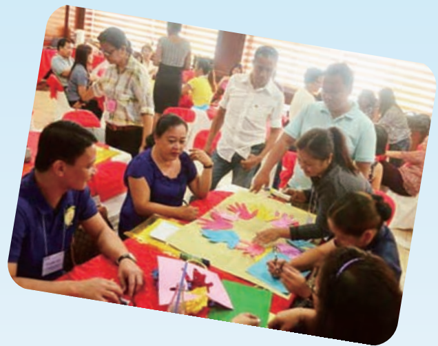
イベントでは、子どもたちにとってより良い地域となることを目指し、参加者が積極的に意見を交わしました

また、2013年9月16日～19日、自治体レベルで子どもたちを守るための機能を強化・維持することを目的とした研修を行いました。トレーニングには、市の社会福祉開発局や議会、レイテADPが活動しているバラングイの警察、教育省、子どもの福祉のための小委員会などから計47人が参加し、互いに協力し合って子どもたちを守るための機能を強化、維持するための計画を自治体、市、地域ごとに作成しました。