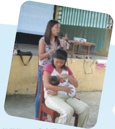
母親学級で母乳育児についての研修が行われました