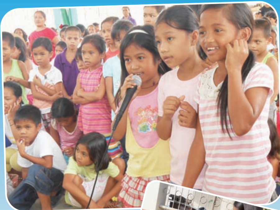
子ども月間に開かれたイベントでは、子どもたち自身が子どもの権利と責任について話し合いました

また、地域では、栄養不良がとても多く見られます。この問題に対処するため、タクロバン市の4つの地域で家庭菜園の支援を行いました。うち1つの地域は2013年5月から家庭菜園の支援が始まり、16世帯が参加し、各世帯の希望に応じた種子と肥料を支援しました。