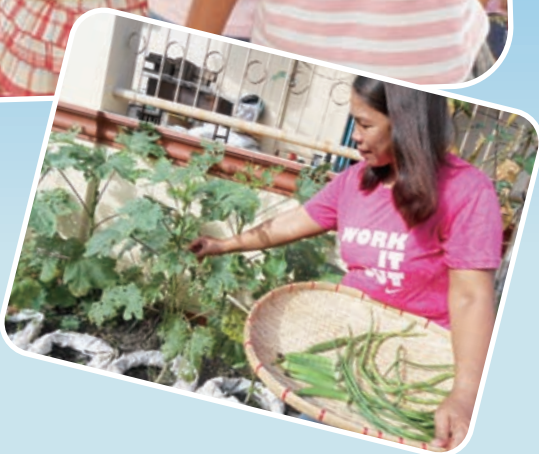
家庭菜園の支援を受け、さやいんげんやオクラが収穫できるようになり喜ぶ女性