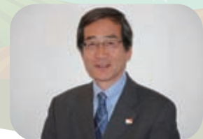
特定非営利活動法人 ワールド・ビジョン・ジャパン 常務理事・事務局長

皆さまのチャイルド、そしてすべての子どもたちが健やかに成長できる地域となることを目指し、活動を続けてまいります。