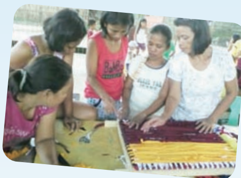
足マットの製造方法を学ぶメンバーたち

地域内の有志メンバーによる貯蓄・融資組合 (COMSCA) による活動を行い、2013年度は、計12のCOMSCAが運営されました。メンバーは週に一度集まり、それぞれ少額を出し合いグループとして貯金をし、その貯金で子どもの制服や、食料、薬など、家族の必需品の購入や、家族や親族の事故、病気、死亡などの非常事態が発生した際に、低利で融資を受け