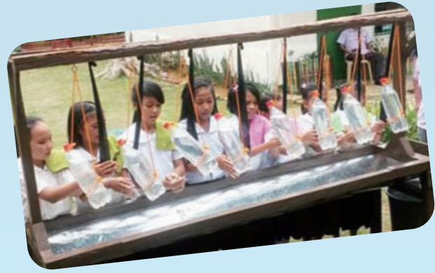
「世界手洗いの日」のイベントで、正しい手洗いの仕方を実演する小学校の児童たち

地域の小学校で行われた「世界手洗いの日」のイベントを開催し、教師や地域の代表者、教育省の関係者など計55人が参加しました。このイベントでは、手洗いの大切さを伝えただけでなく、子どもたちの健やかな成長のために、子どもたちの健康が支えられ、教育を受けることができ、参加する権利が保障される地域を目指す活動への協力と理解を訴えました。