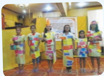
「小さな先生」になるためのワークショップで、成果を発表する子どもたち

ADPの活動で学んだ子どもの権利と責任について、人形劇を使って説明する12歳～13歳の子どもたち。391人の子どもたちが、この「小さな先生」たちから学びました。この「小さな先生」たちは、子どもの権利について自分たちの仲間伝えることだけでなく、将来責任感のある大人になるための研修も受けました