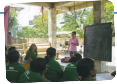
社会福祉プログラムについての説明会の様子

社会福祉省と協力し、2つの貯蓄・融資組合に所属する36人の組合員に対し、フィリピン政府が行っている社会福祉プログラムについての説明会を行いました。このプログラムを通じて資金援助を受け、生計向上に役立てるための事業を行うことを検討しています。説明会の後には、組合員同士で話し合いを行い、服の製造・販売や肉の販売を行ってはどうかという意見が挙げられました。今後、地域住民の生計向上に役立てられることが期待されています。