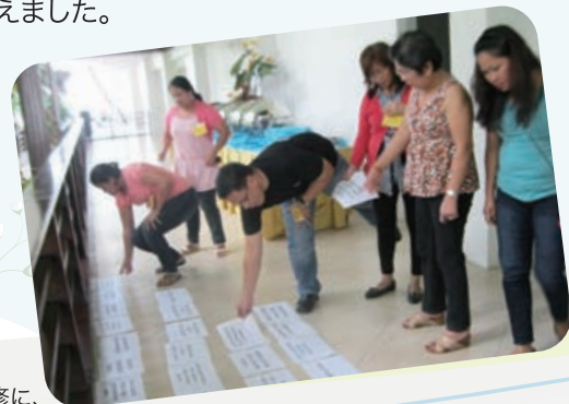
災害発生時に備えた研修に、地域の行政機関や住民が参加しました