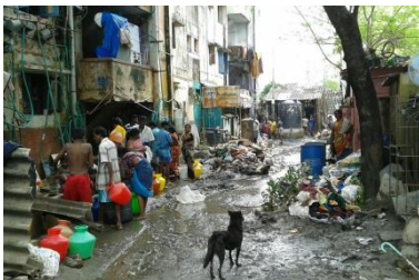
水が引いた後の様子 瓦礫やヘドロが散乱しています