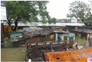
洪水発生直後のサイダペット地区家屋の屋根近くまで浸水しました